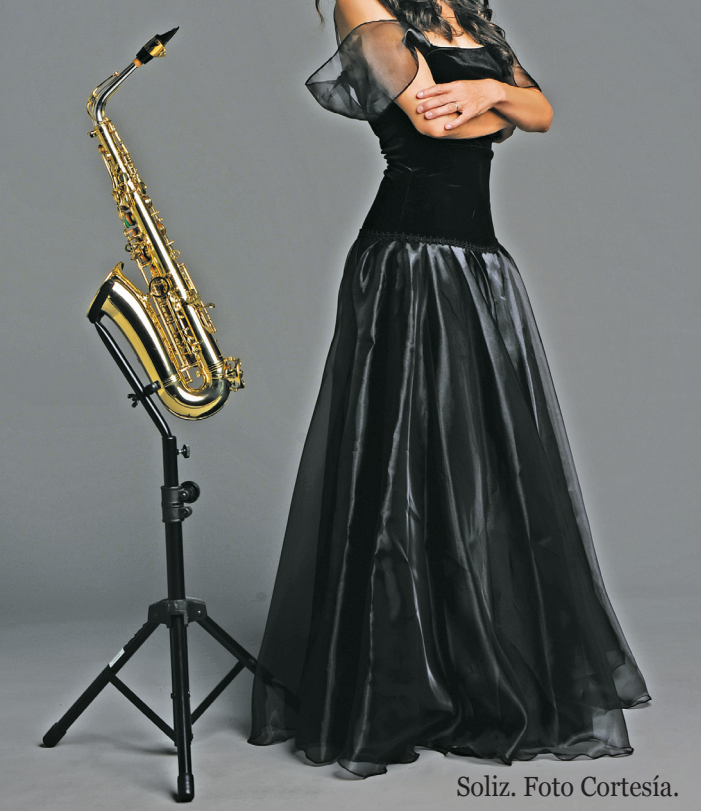
Soliz. Foto Cortesía.

... la vida de una mujer de la "redención", "reconciliación", "liberación" y "salvación", a través de imágenes, los sonidos y el arte de la mente.